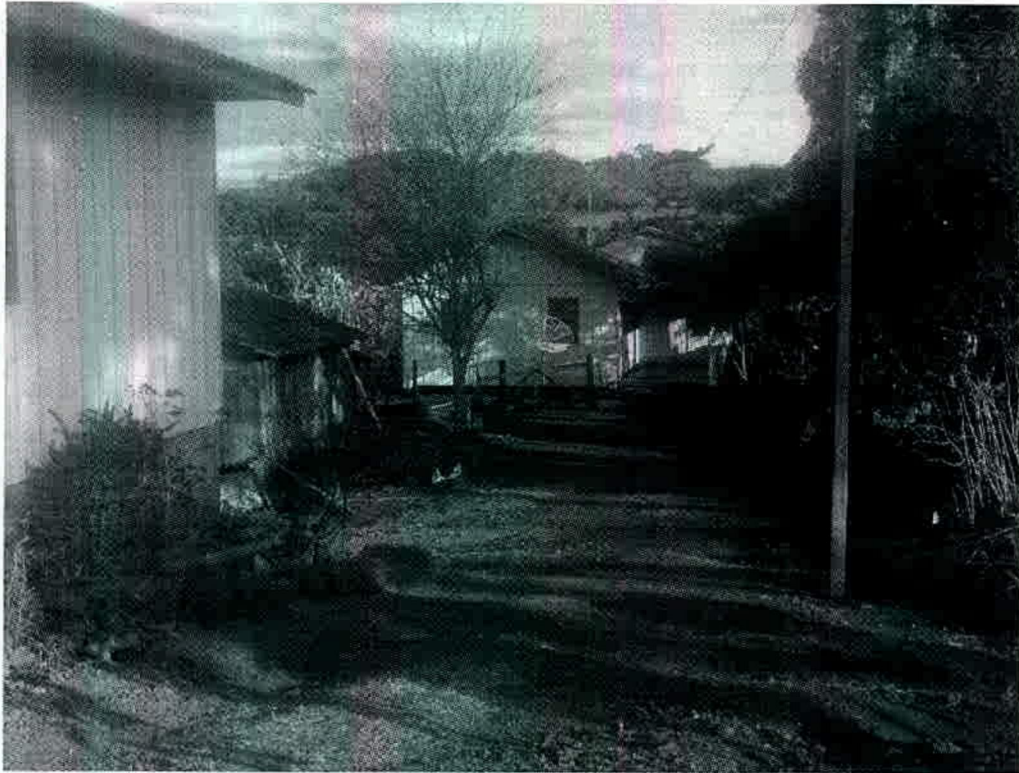
Foto 3 – Vista parcial do imóvel urbano descrito como “imóvel 2 – fls.28”

RECÉBIMENTO Aos, 14 de agosto de 13. Recebi estes autos Cantagalo-PR, 14 1 08 13