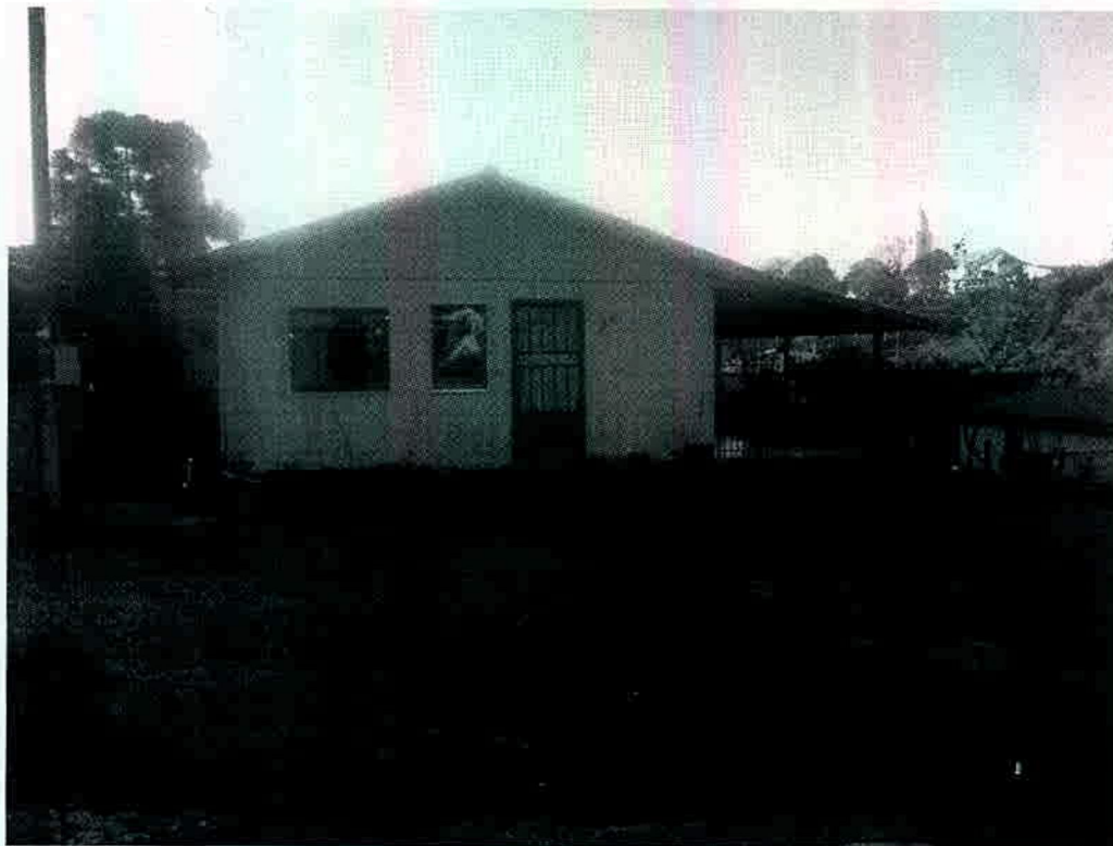
Foto 2 – Vista parcial do imóvel urbano descrito como “imóvel 2 – fls.28”