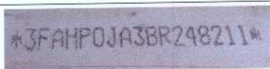
Figura 3 – Número de Identificação Veicular-NIV encontrado no automóvel examinado