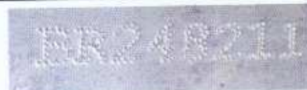
Figura 4 – Numeração do motor encontrada no automóvel examinado.