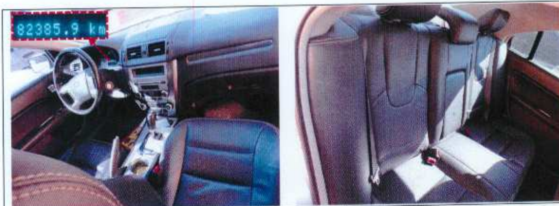
Figuras 5 e 6 – Ilustram o interior, parte anterior e posterior do automóvel examinado, respectivamente, com destaque para o odômetro.