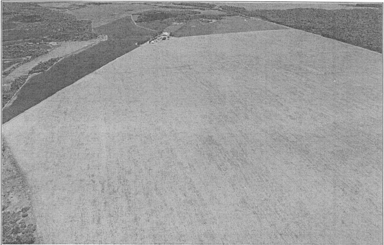
Figura 3: Visão panorâmica da Fazenda Pôr do Sol III. Pela imagem, é possível verificar o "tom morrom" da propriedade em comparação com as demais propriedades limítrofes. Cultura de milho abandonada.