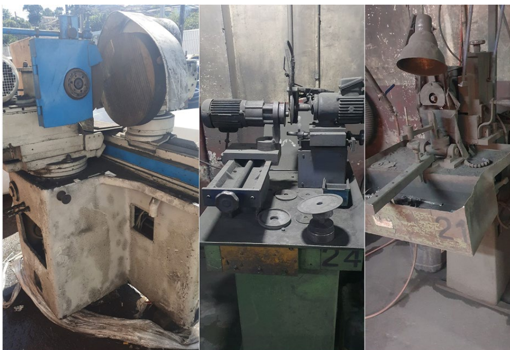
RETÍFICA COM PLACA MAGNÉTICA

Retífica com placa magnética / Retífica lateral dupla / Retífica lateral simples