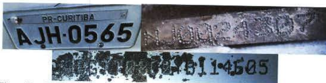
Figura 2 – Dados identificadores do veículo. Nº da placa, nº do motor e nº do chassi (9BGTT08C0YB114605).

Na sequência, foi verificada a presença da etiqueta com o número VIS ( Vehicle Identification Section ) na coluna da porta direita e no compartimento do motor, bem como gravações do mesmo número em seus vidros, não sendo constatados indícios visíveis de adulteração.