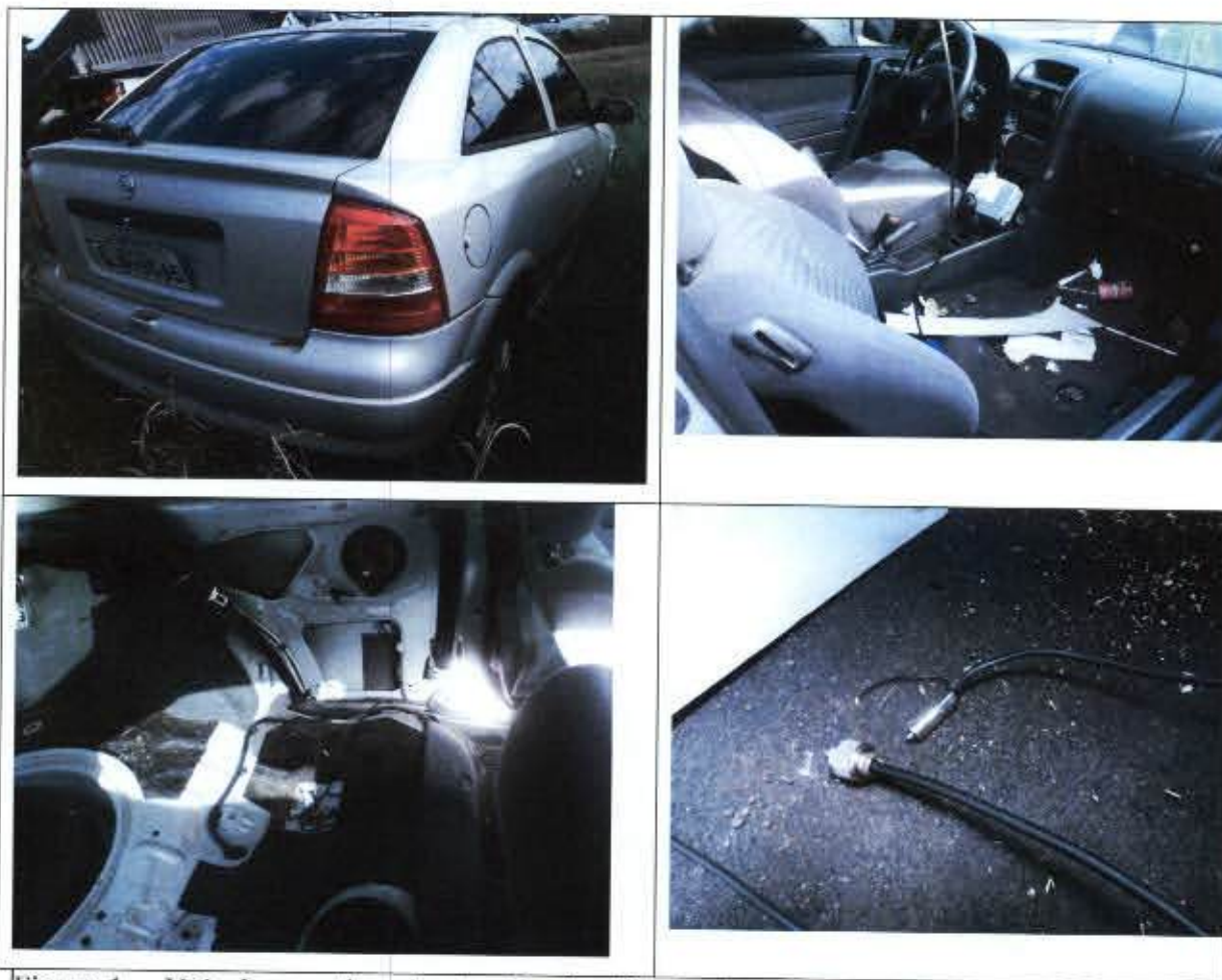
Figura 1 – Veículo questionado. Interior danificado, fiação condizente com a instalação de rádio transceptor. O rádio não foi localizado no veículo.

O presente laudo apresenta o resultado dos exames efetuados em 01 (um) veículo marca/modelo GM/Astra GL 1999/2000, de placas AJH-0565 Curitiba/PR – Figura 1.