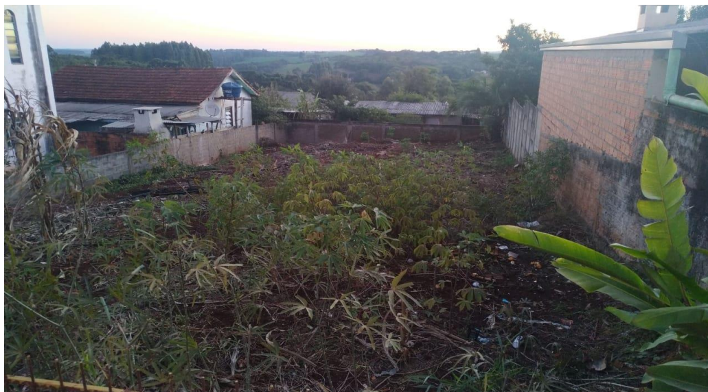
Foto 2 – Vista parcial do terreno urbano ao lado da Igreja Brasil para Cristo