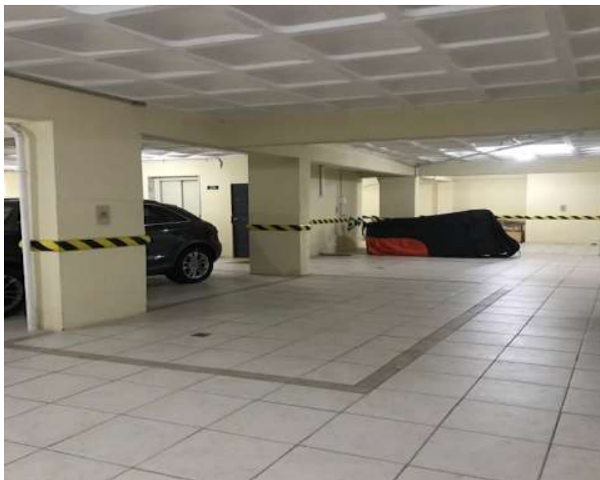
Garagens (Matrícula nº 02)