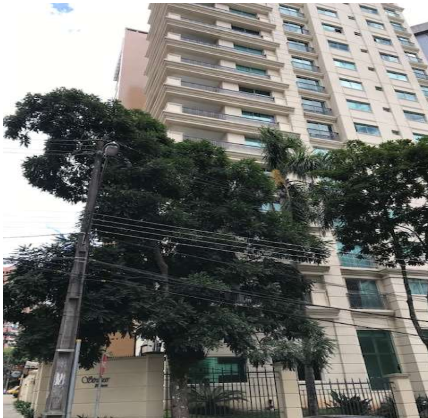
Edifício Strauss Palace