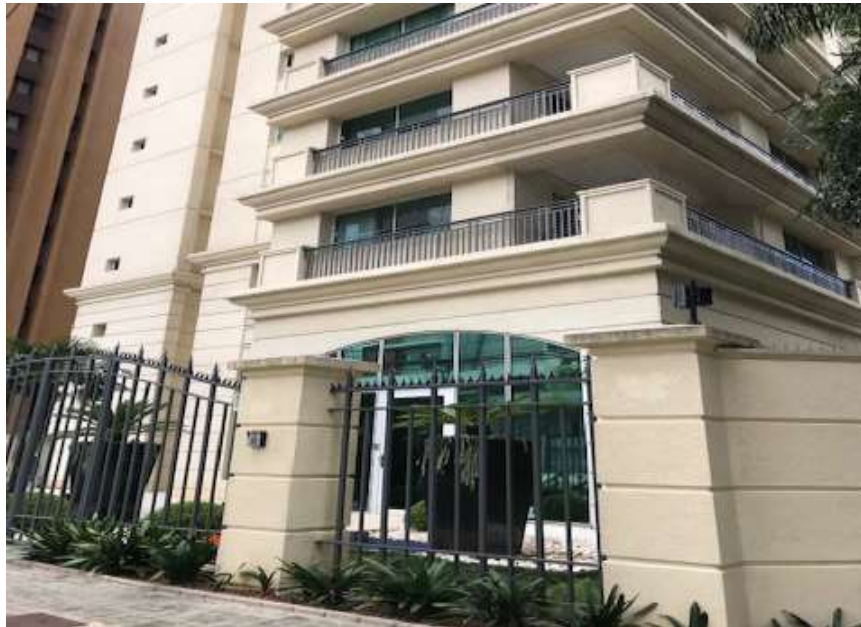
Edifício Strauss Palace