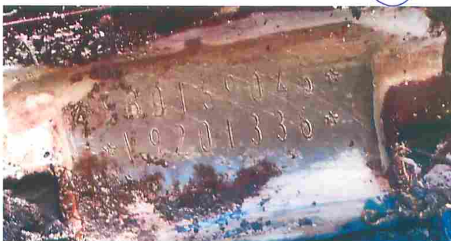
Fotografia nº 03- imagem da numeração de chassi aparente do veículo.