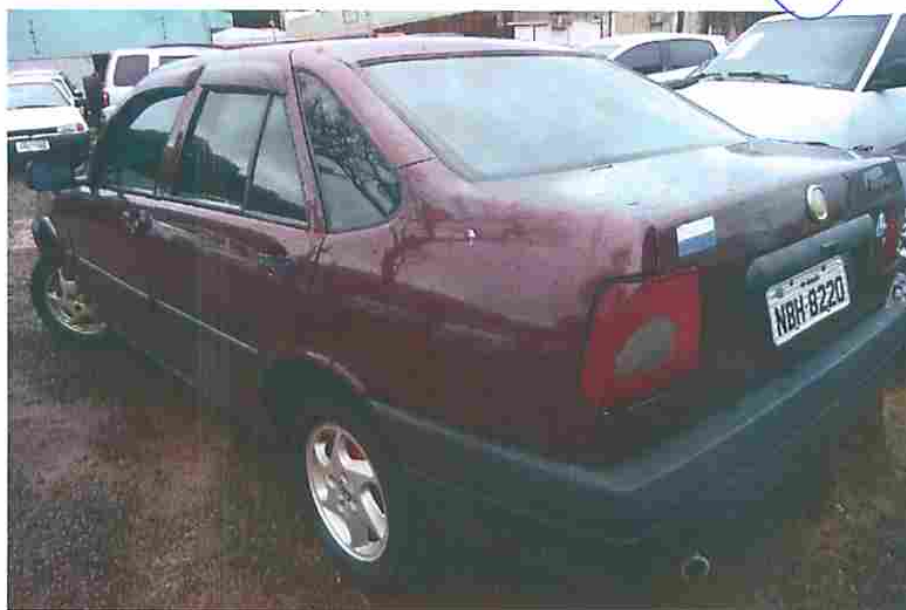
Fotografia n o 01 - imagem do veículo examinado.