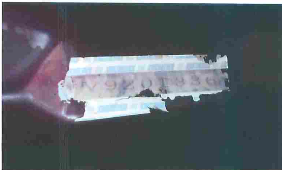
Fotografia nº 04- imagem de uma das etiquetas.