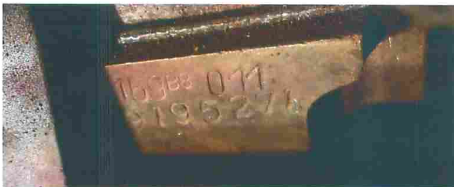
Fotografia nº 05- imagem da numeração do motor.

Este laudo foi redigido pelo Perito que o subscreve e impresso em quatro folhas de papel timbrado do Instituto. Ilustram cinco fotografias impressas. E são essas as declarações que em sua consciência tem o Perito a fazer. E por nada mais haver, deu-se por findo o exame solicitado que de tudo se lavrou o presente laudo que vai devidamente assinado pelo Perito.