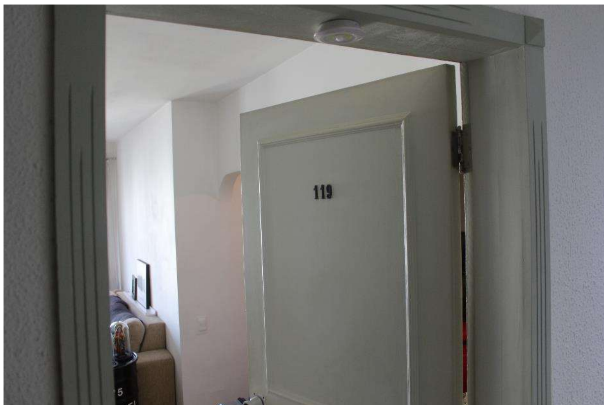
Objeto Pericial – Porta de Entrada.