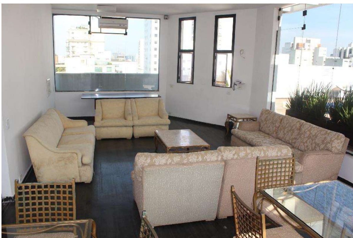
Condomínio Edifício Saint Thomas Residence Service – Salão de Festas