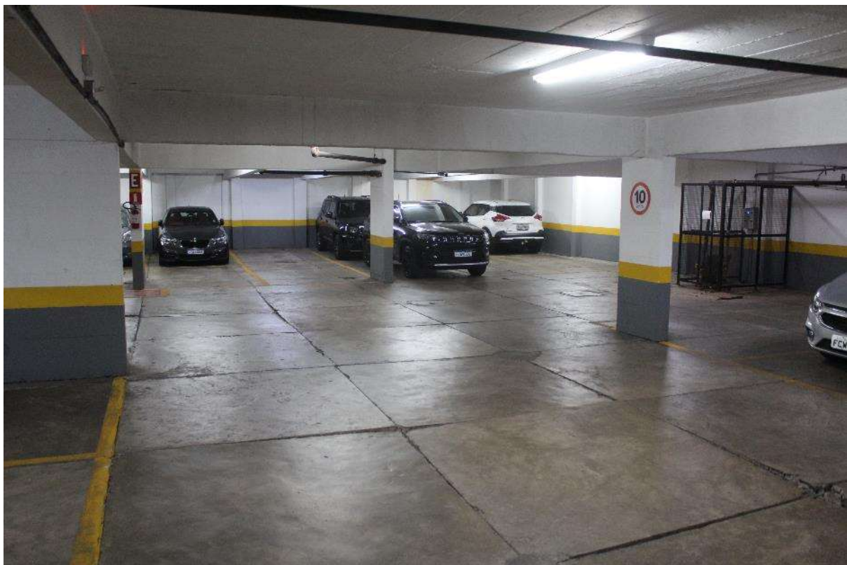
Condomínio Edifício Saint Thomas Residence Service – Garagem