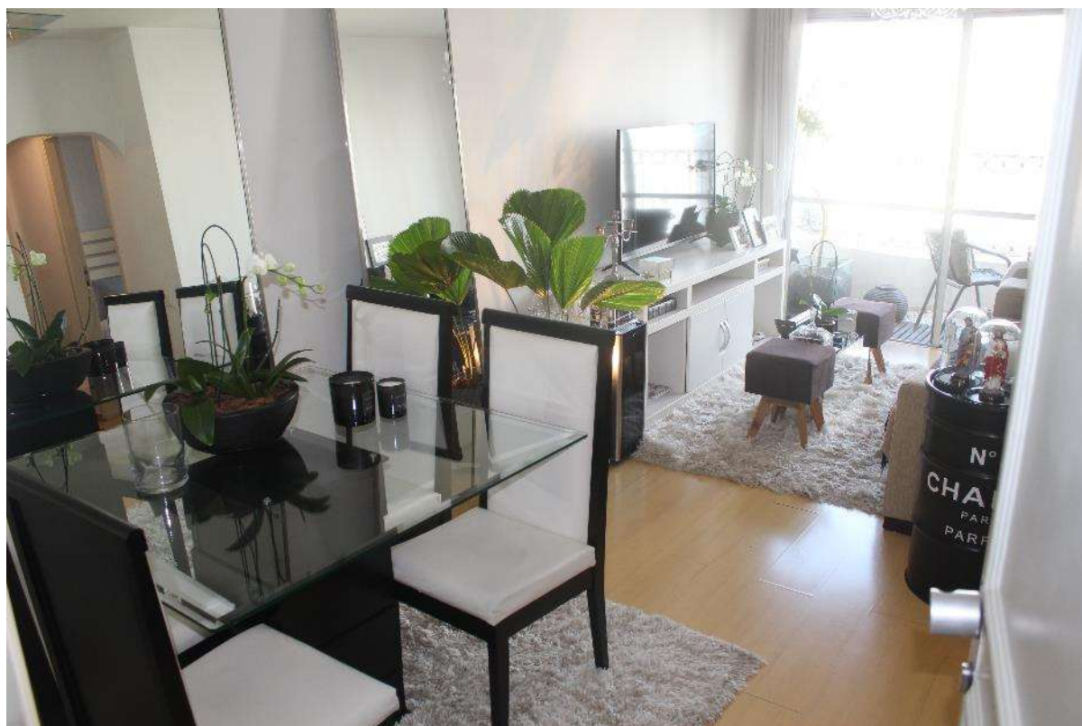
Objeto Pericial – Sala de Estar/Jantar.