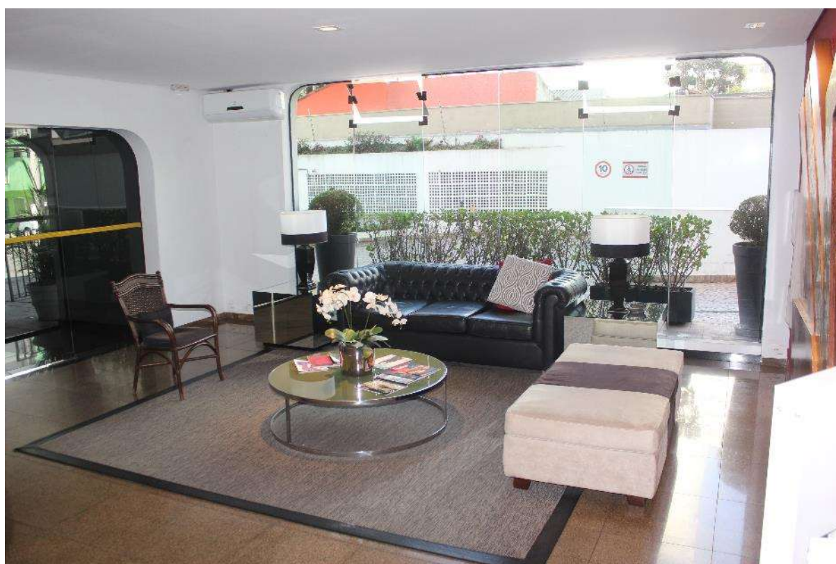
Condomínio Edifício Saint Thomas Residence Service – Recepção 24 Horas