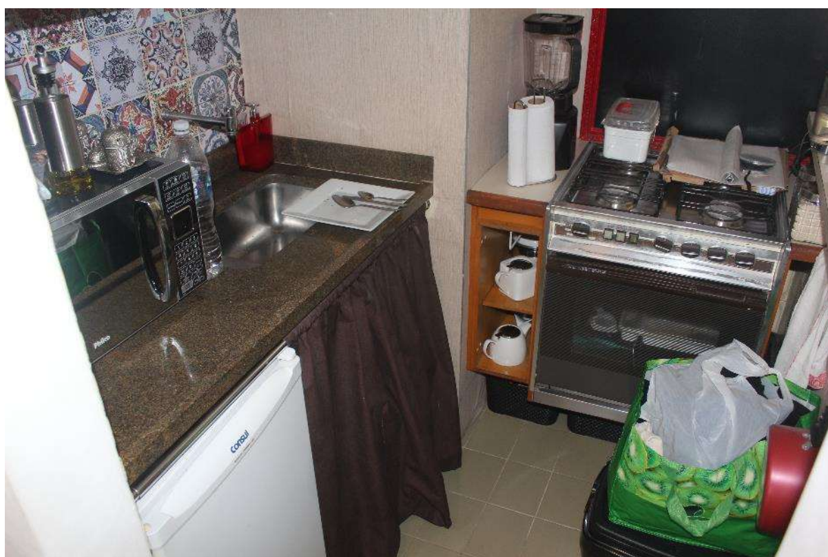
Objeto Pericial – Cozinha