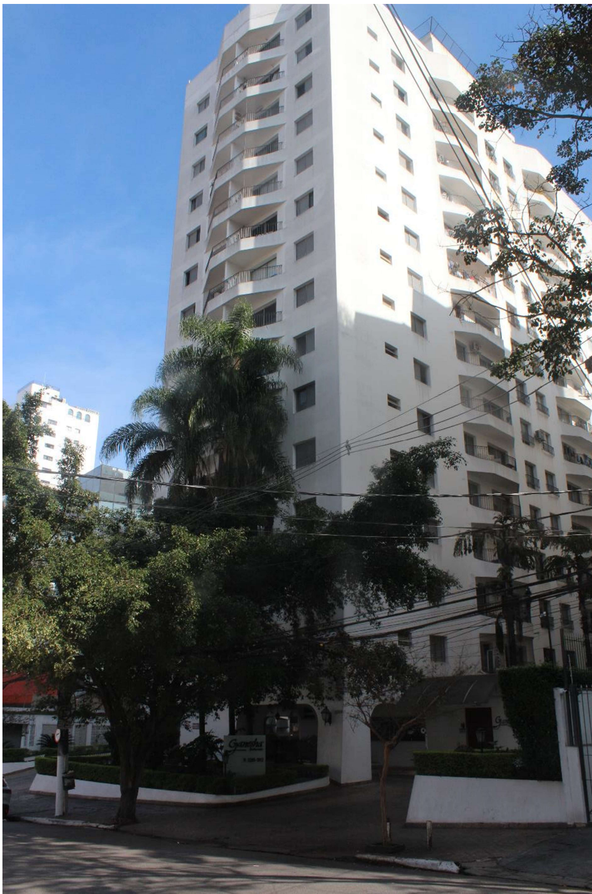
Condomínio Edifício Saint Thomas Residence Service – Fachada

PEA – Engenharia Legal e Diagnóstica Rua Dr. Fadlo Haidar, 106 (42) Vila Nova Conceição - São Paulo/SP