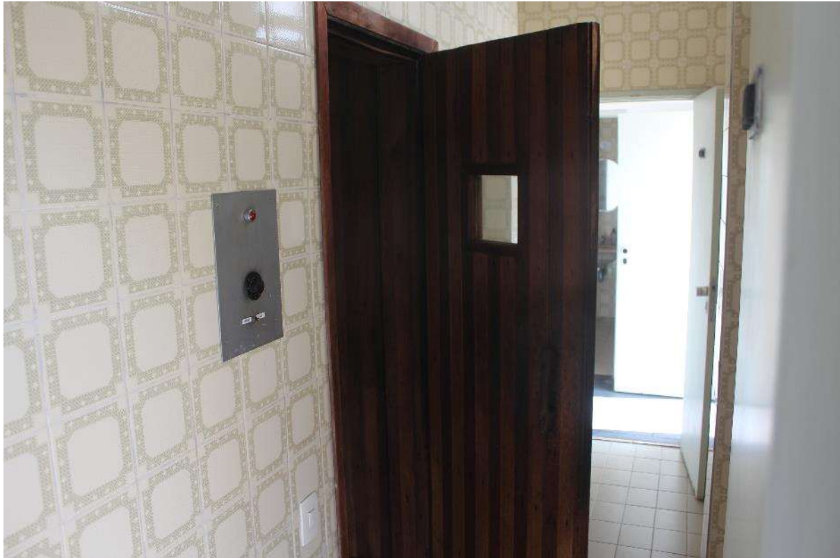
Condomínio Edifício Saint Thomas Residence Service – Sauna