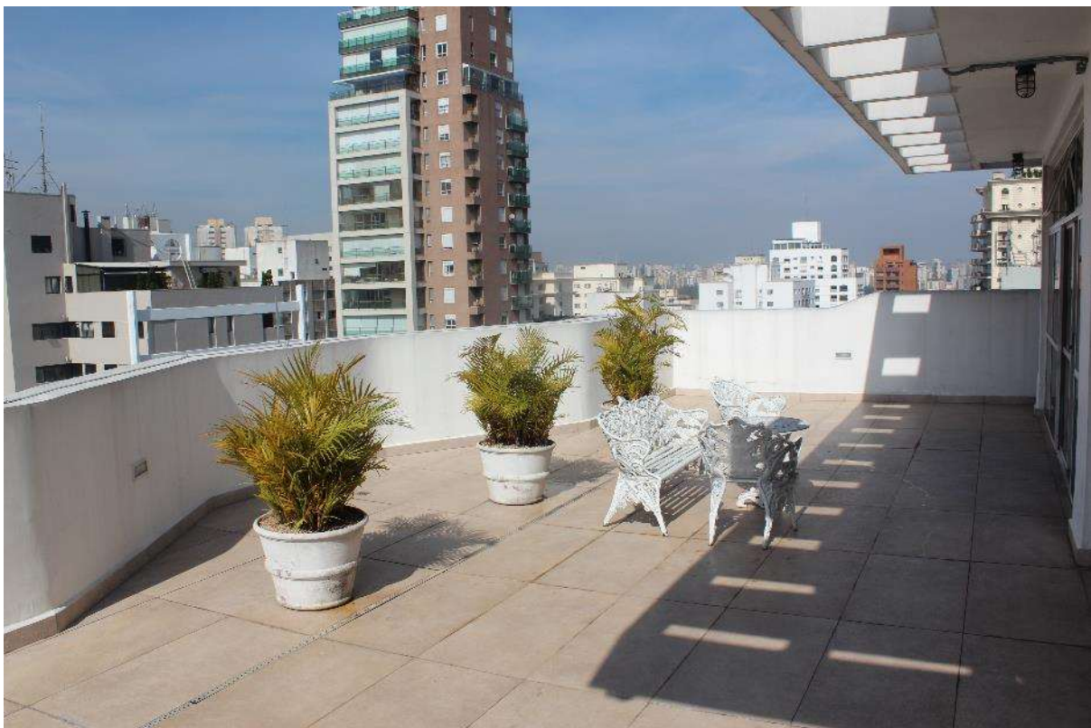
Condomínio Edifício Saint Thomas Residence Service – Solarium