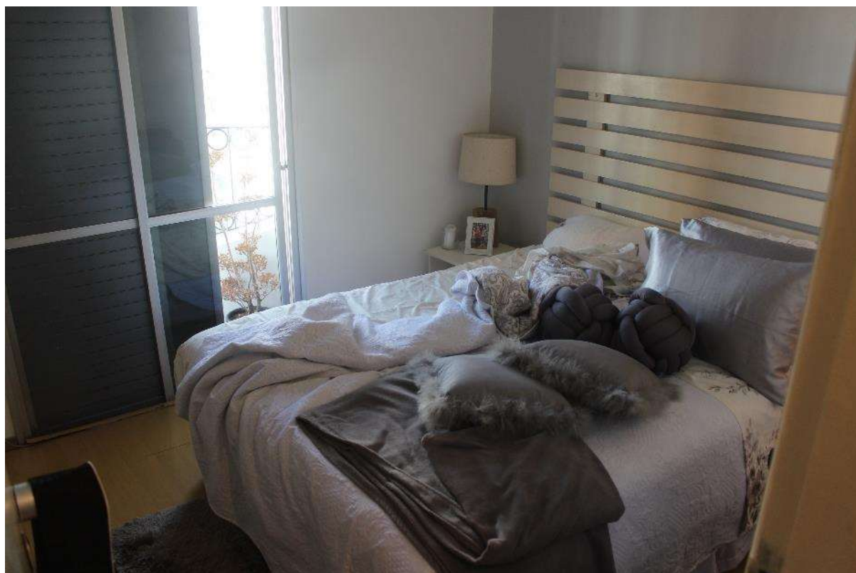
Objeto Pericial – Dormitório 01.