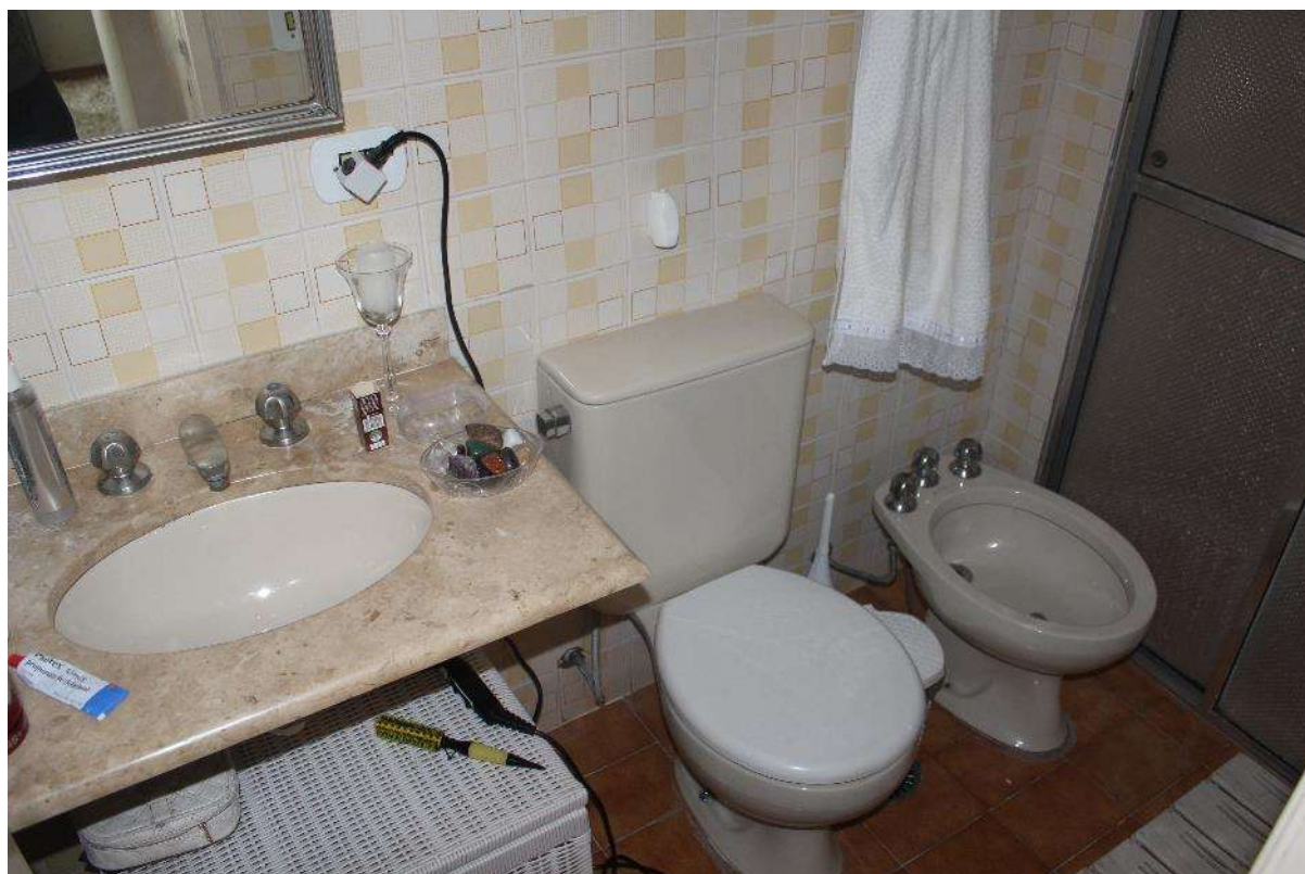
Objeto Pericial – Lavabo/Banheiro.