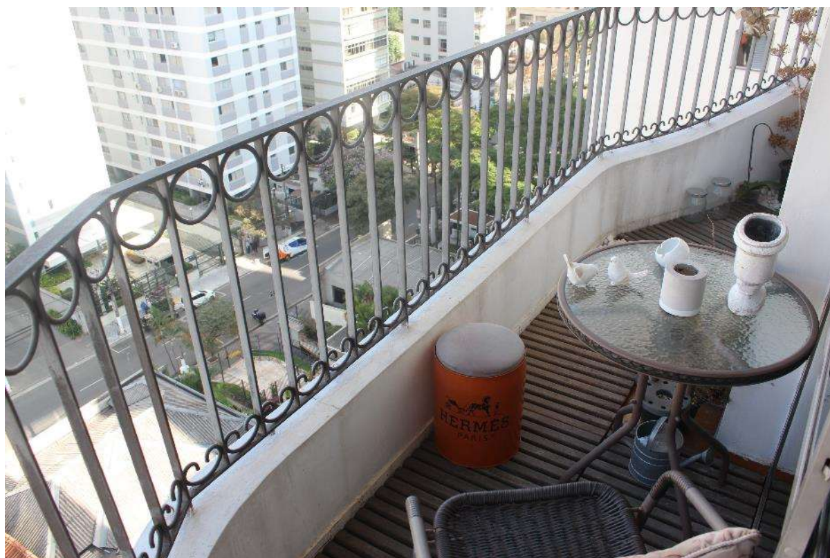
Objeto Pericial – Varanda.