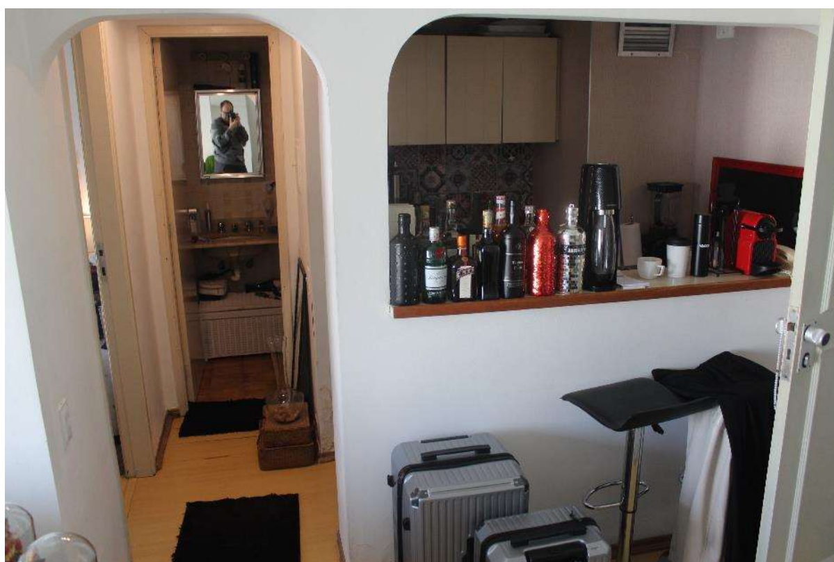
Objeto Pericial – Cozinha