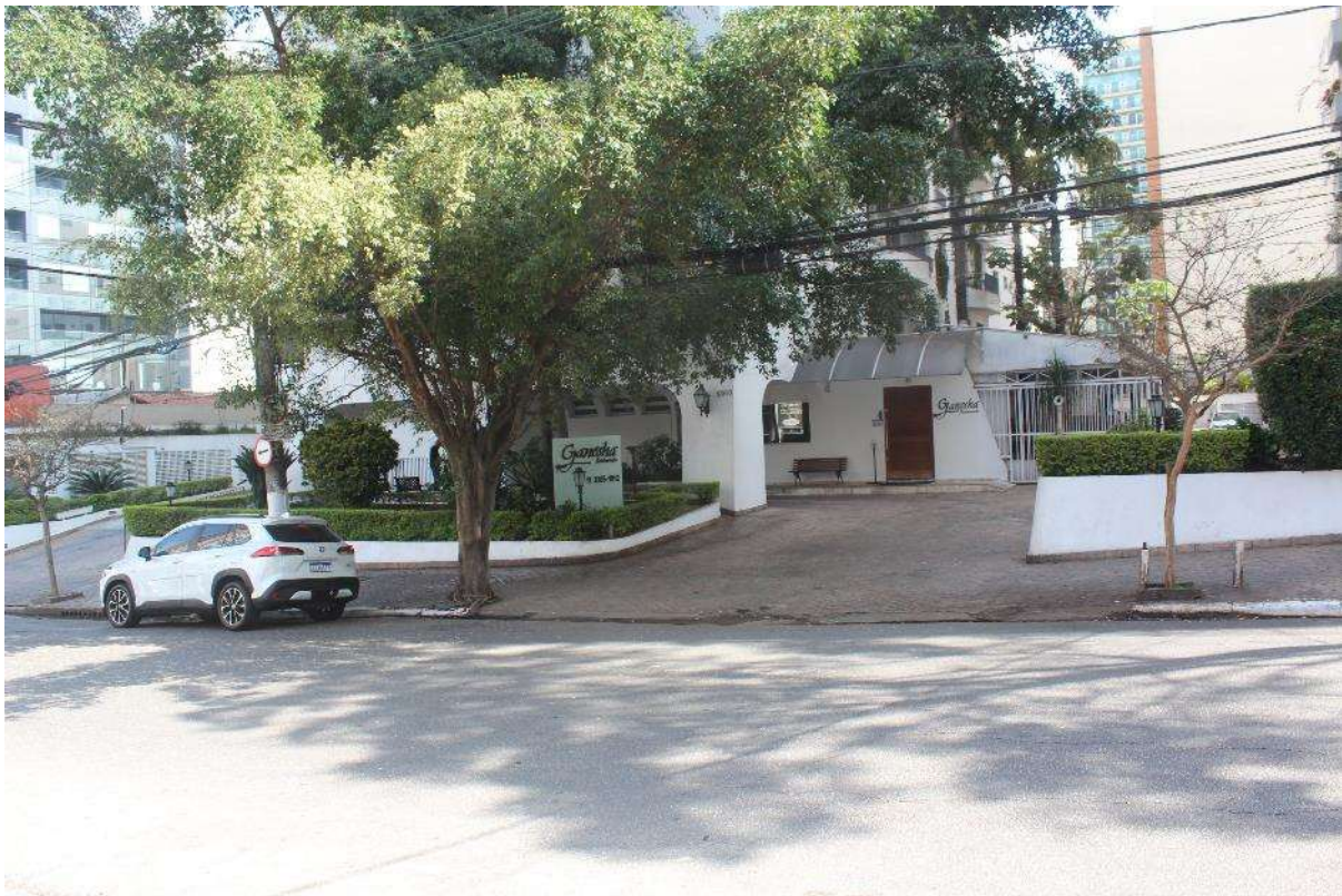
Condomínio Edifício Saint Thomas Residence Service – Fachada

Segue adiante o relatório fotográfico do Condomínio.