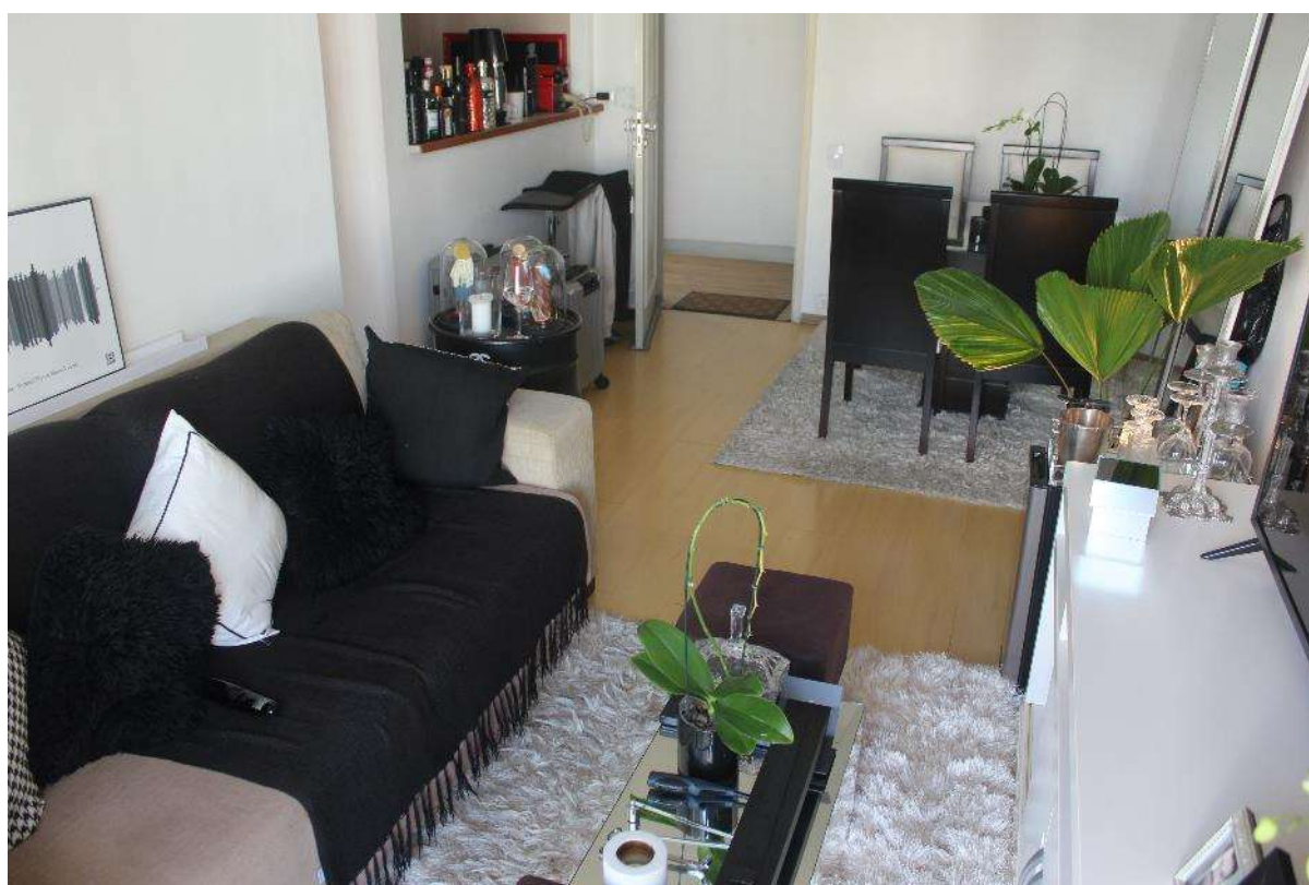
Objeto Pericial – Sala de Estar/Jantar.