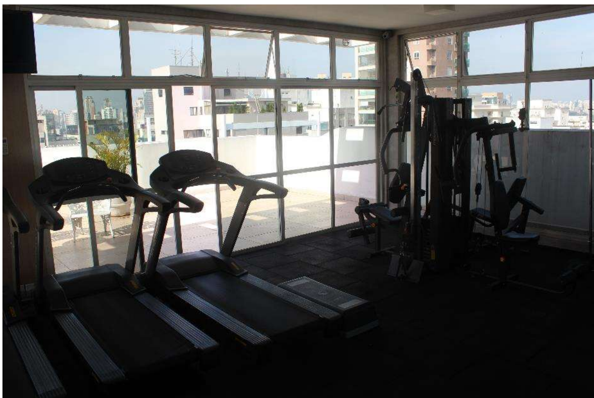
Condomínio Edifício Saint Thomas Residence Service – Academia