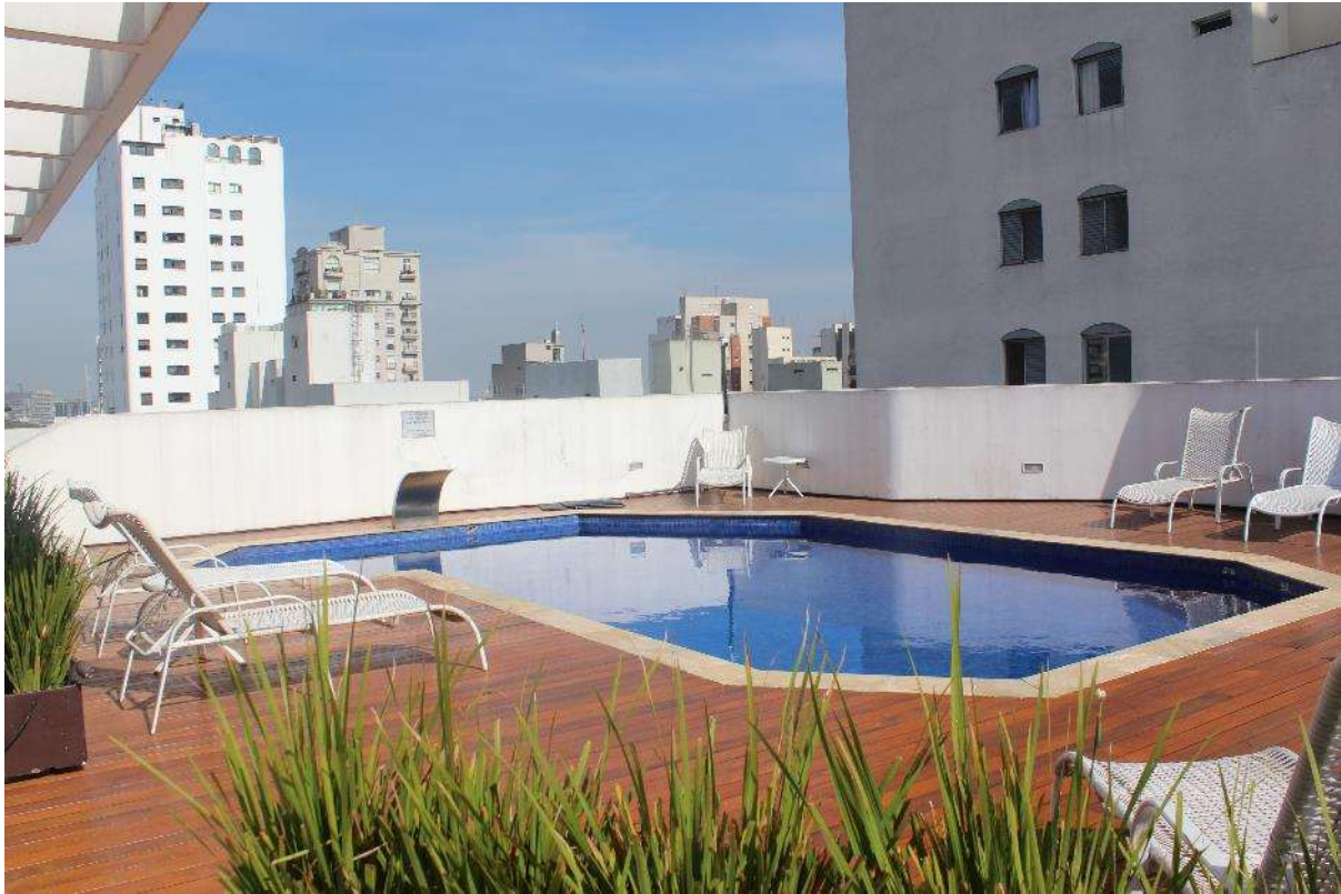
Condomínio Edifício Saint Thomas Residence Service – Piscina