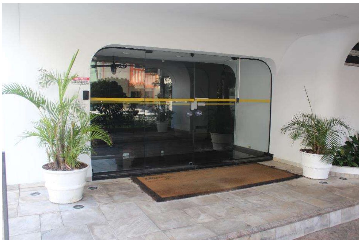
Condomínio Edifício Saint Thomas Residence Service – Entrada Social