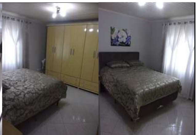
suíte (vistoria em 11/03/2022)