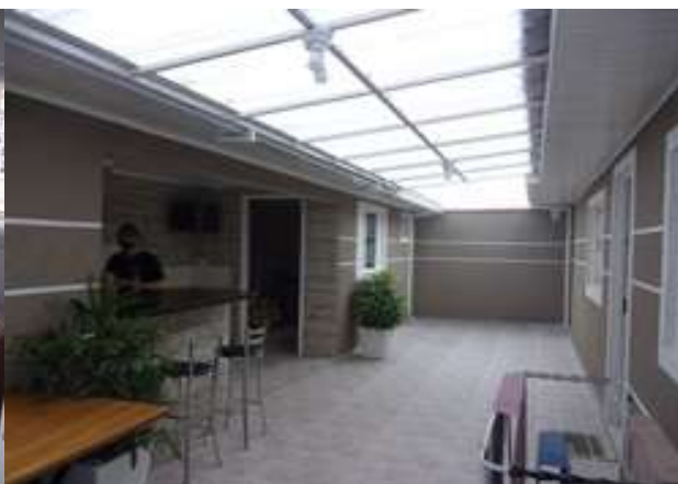
edícula (vistoria em 11/03/2022)