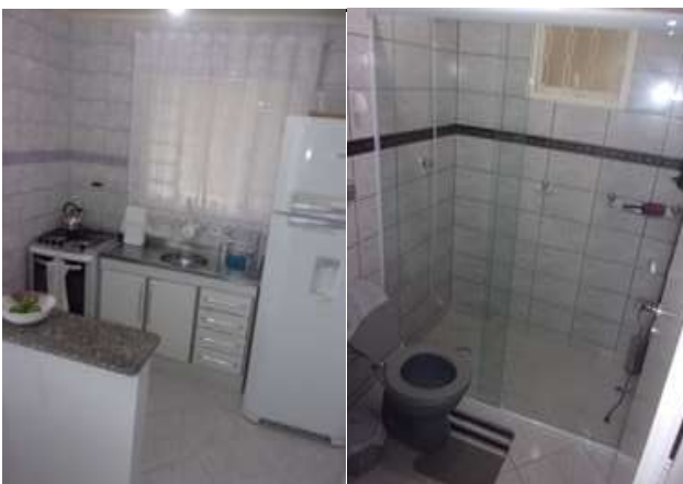
cozinha e bwc (vistoria em 11/03/2022)