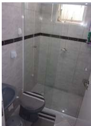
bwc da suíte e quarto (vistoria em 11/03/2022)