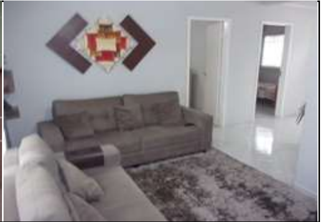
sala (vistoria em 11/03/2022)