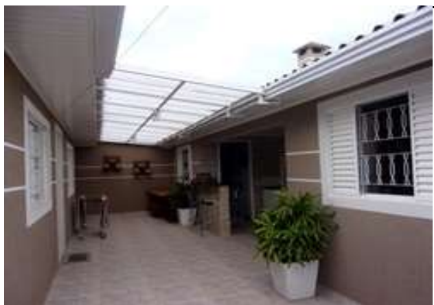
edícula (vistoria em 11/03/2022)