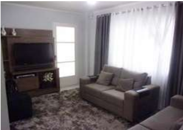
sala (vistoria em 11/03/2022)