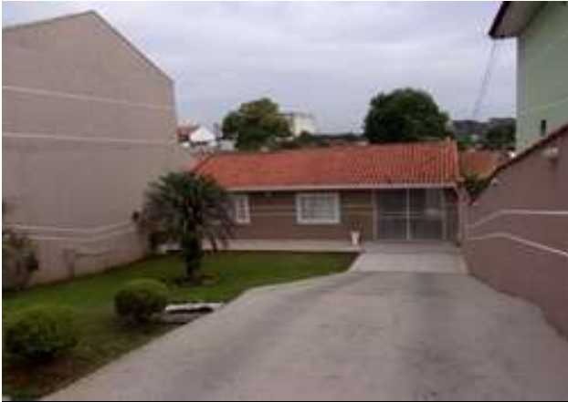
entrada da casa (vistoria em 11/03/2022)