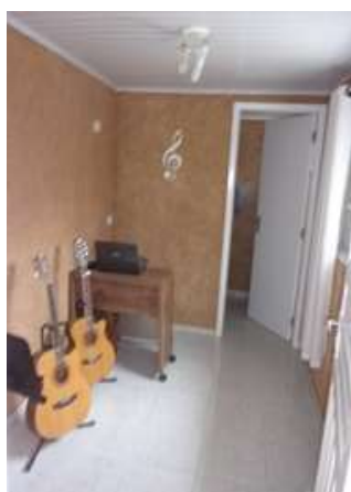
edícula (vistoria em 11/03/2022)