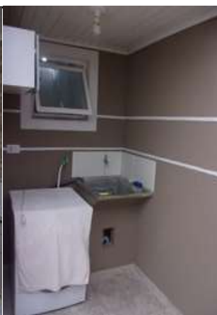
edícula (vistoria em 11/03/2022)