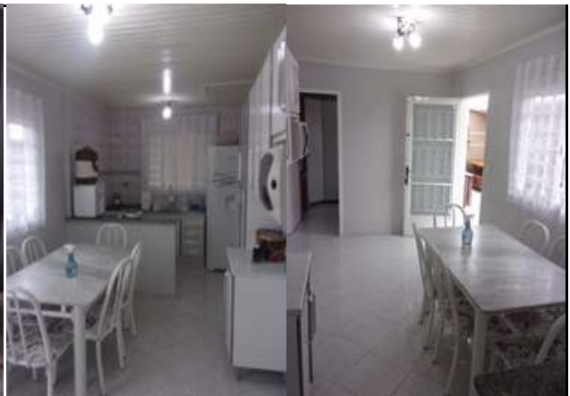
copa/cozinha (vistoria em 11/03/2022)