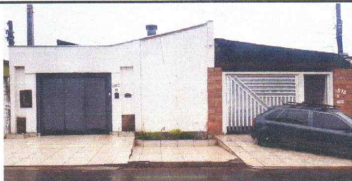
IMAGEM FÍSICA 14/06/2023

DETERMINAR O VALOR DE MERCADO PARA O IMÓVEL, PARA FINS JUDICIAIS, FOI UTILIZADO O MÉTODO "COMPARATIVO DE DADOS DE MERCADO" QUE PERMITE A DETERMINAÇÃO DO VALOR.