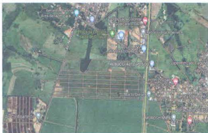
Vista aérea do imóvel