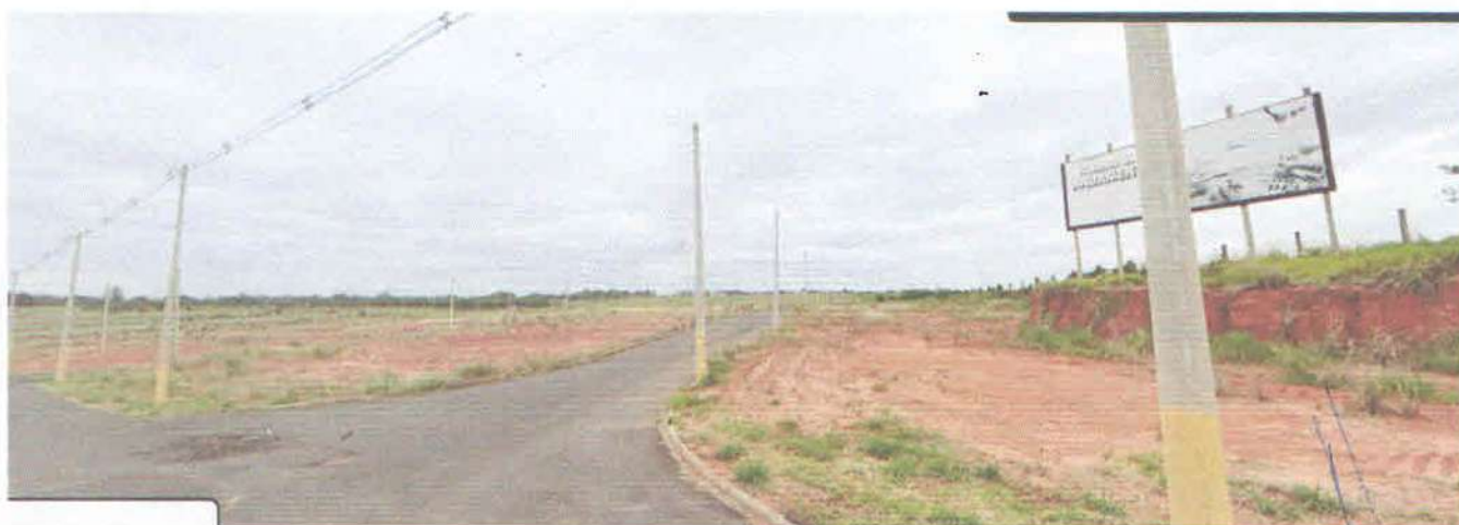
Vista frontal do Empreendimento (loteamento)

Este documento é cópia do original, assinado digitalmente por GREICY KELLY FERREIRA DE SOUZA, protocolado em 02/10/2024 às 12:43 , sob o número WLIS24700758422 Para conferir o original, acesse o site https://esaj.tjsp.jus.br/pastadigital/pg/abrirConferenciaDocumento.do , informe o processo 0004346-32.2022.8.26.0322 e código GSeQuurfm.