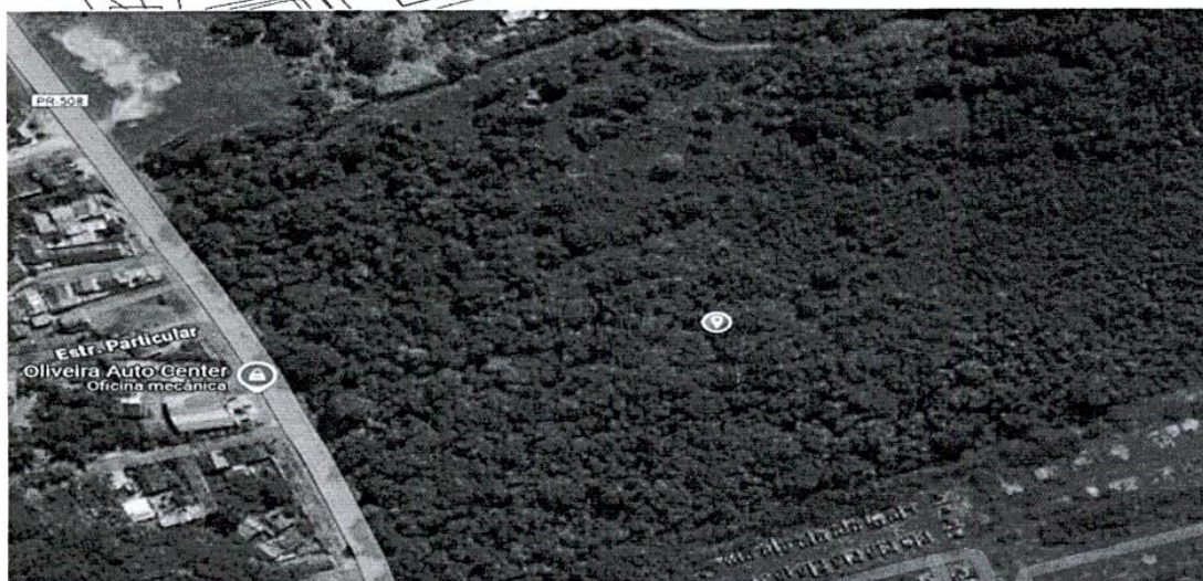
Lote vago e sem acesso, a cerca de 2,1 km do centro de Matinhos/PR.